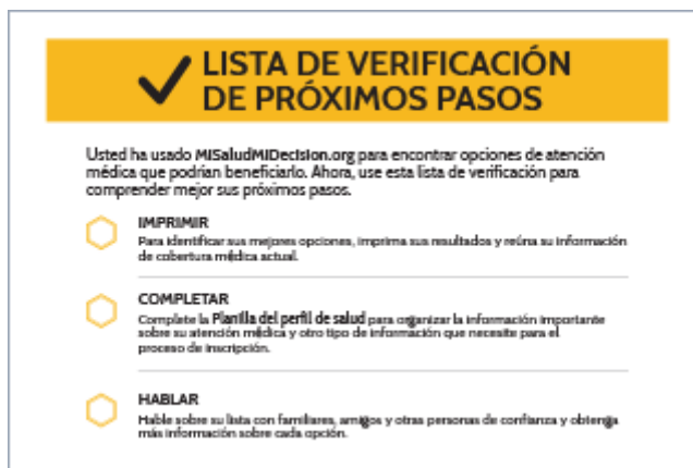
Lista de verificación de próximos pasos (PDF)