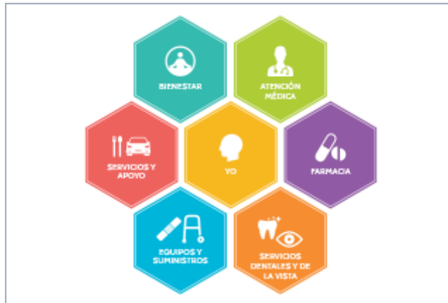
Planilla del perfil de salud (PDF)

Usa estas herramientas para comprender tus próximos pasos y organizar tu información de salud: