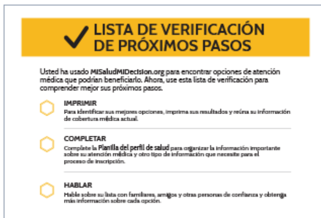
Lista de verificación de próximos pasos (PDF)