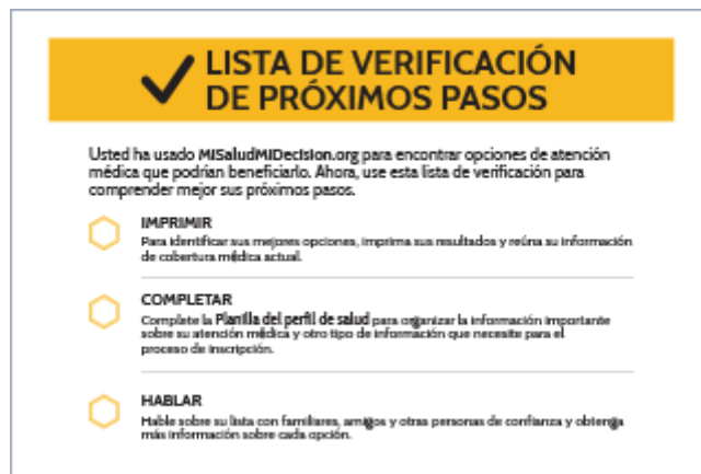
Lista de verificación de próximos pasos (PDF)