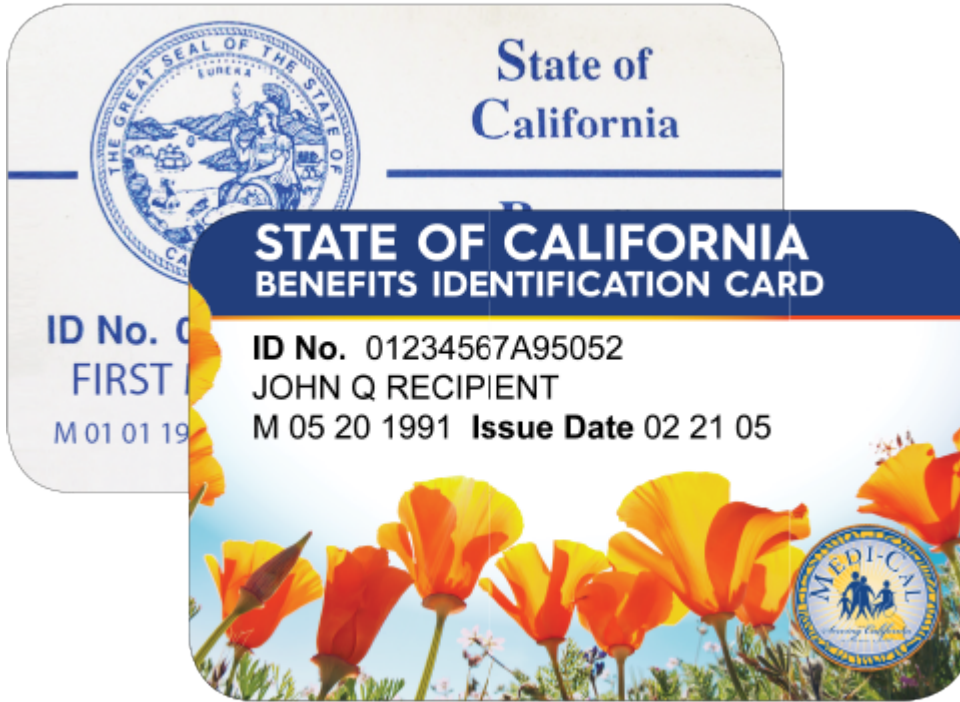
Tarjeta de Medi-Cal (antigua/nueva)

Estancias breves en un centro de servicios de enfermería